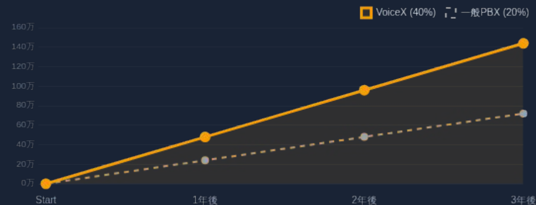
累積利益の推移イメージ（3年間）